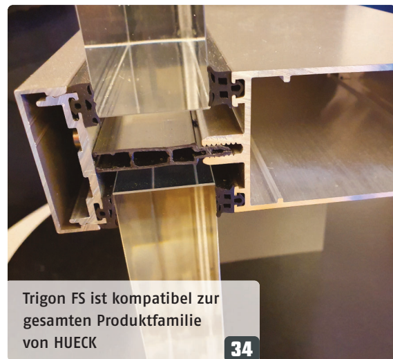
Trigon FS ist kompatibel zur gesamten Produktfamilie von HUECK