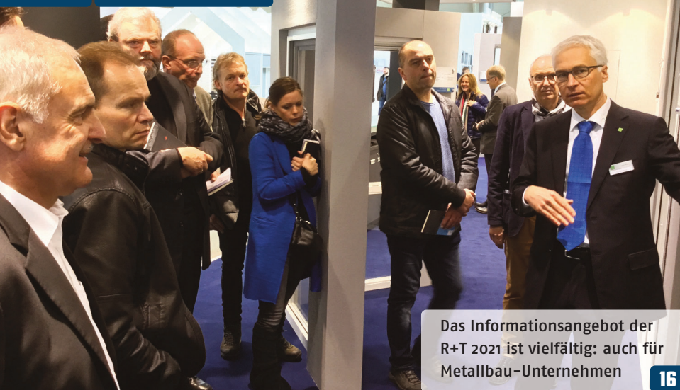
Das Informationsangebot der R+T 2021 ist vielfältig: auch für Metallbau-Unternehmen